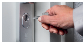
Haal de sleutel uit het slot