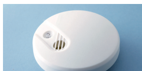
Rookmelder redt levens