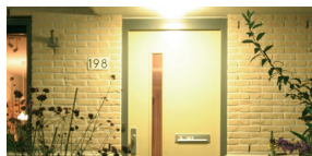
Zet inbrekers in het licht